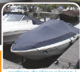
carpitas de playa y lonas o cortinas de praia e lonas