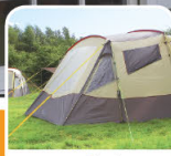
carpas / tendas