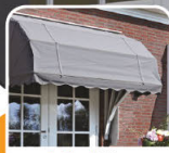
toldos / toldos